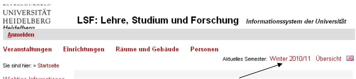
Abb. 1.0 Semesterauswahl

Bitte beachten Sie, dass Sie direkt nach dem Anmelden in LSF das korrekte Semester (oben rechts in der Navigationsleiste) auswählen