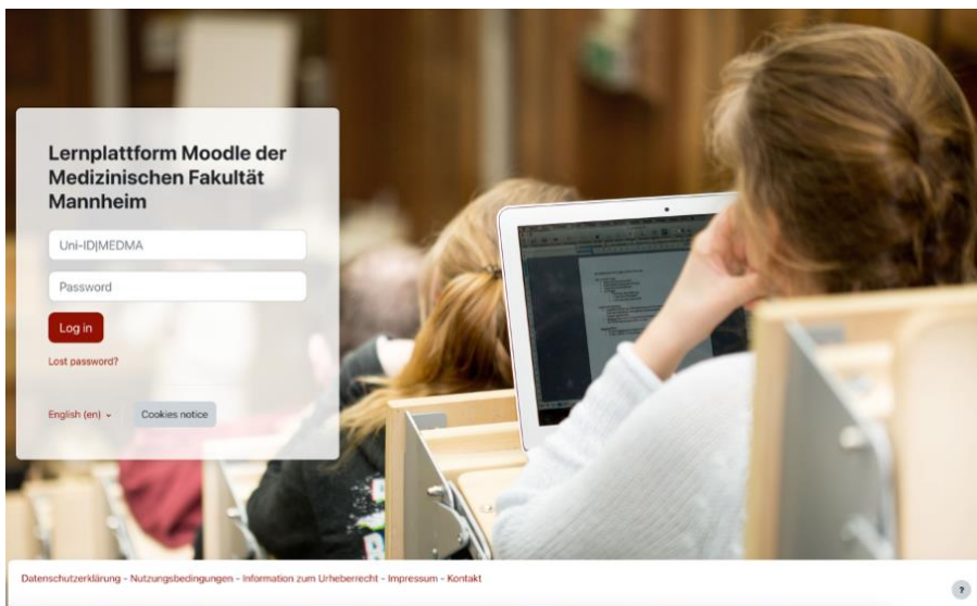
Abbildung 1: Login-Seite

Wir empfehlen, die Lernplattform auch auf mobilen Geräten im Browser zu verwenden, da mehrere Funktionen von der App leider nicht abgebildet werden.